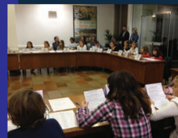
Conseil Municipal Jeunes