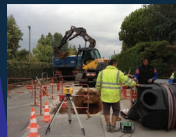
Le tour des chantiers