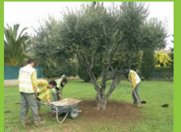
Cadre de vie