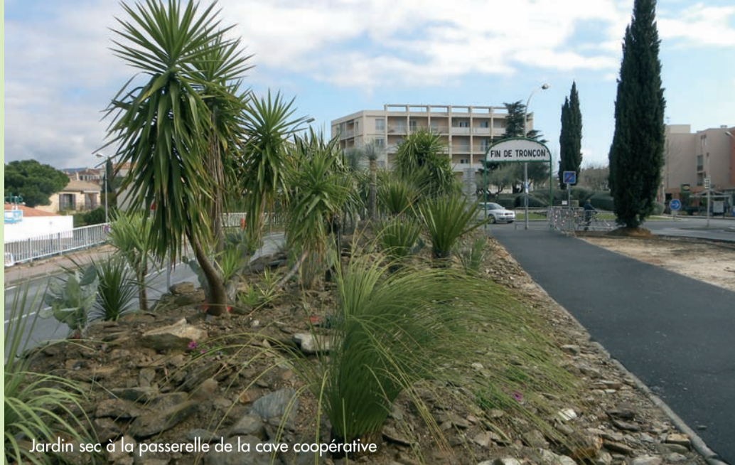
Jardin sec à la passerelle de la cave coopérative

Avenue Marcel-Pagnol, des oliviers ont été replantés dans les deux espaces verts bordant la voie. Là aussi, ces plantations s'accompagneront de la création de banquettes arrondies en pierre pour remplacer les actuels bancs vétustes. Enfin, un olivier a été installé sur le jardin devant la Poste. Ces oliviers proviennent des abords du Monument aux Morts du pont de la cave coopérative qui est actuellement restructuré en jardin sec. La Ville, avec le concours du Jardin des Oiseaux, va planter des yuccas et autres succulentes sur talus de schiste. Une rénovation qui complètera harmonieusement celle menée sur le pont et la passerelle de la Coopérative, dont la piste cyclable a été rendue à ses utilisateurs à la mi-mars. Sur l'avenue de Gaulle, ce sont des palmiers qui vont prochainement être plantés. Le service des Espaces Verts installera également des plantes adaptées au climat méditerranéen devant le parking Victor-Hugo. Avec la reprise des enrobés du rond-point de Gaulle, ces derniers travaux mettront un terme à la rénovation de cette avenue débutée à l'automne dernier.