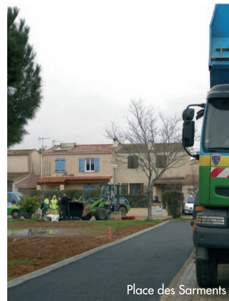
Place des Sarments

Ainsi que le prévoit l'article 9 de la loi du 27 février 2002, codifiée L.2121-27-1 dans le code général des collectivités territoriales, un espace est réservé, dans le journal municipal, à l'expression des conseillers n'appartenant pas à la majorité municipale. Les propos tenus dans cette rubrique n'engagent que leurs auteurs.