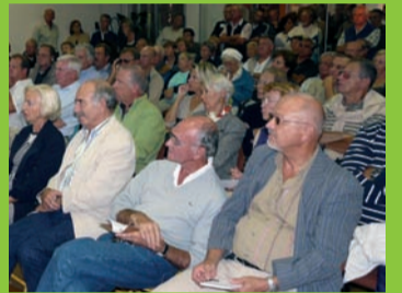
Réunions de quartiers