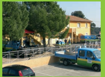
Dossier : Travaux